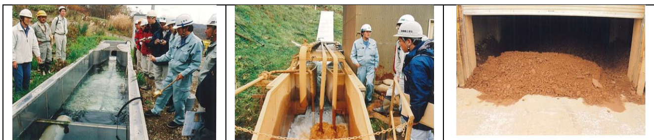
【図 2.4 旧別硫黄鉱山の排水処理】

鉱山からの排水を中和して出てきた脱水ケーキ（泥の固まり）を最終的に処分する堆積場を拡張中。褐色になっているのは水酸化鉄の色です。