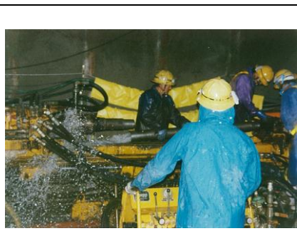
【図 2.1 トンネル工事での先進ボーリングから噴出する地下水】

建設工事の時に掘削によって地下水がどのように変化するかは非常に重要で、工事の死命を制する場合があります。橋梁などの構造物基礎の掘削時やトンネル掘削時の湧水量予測などはその手法が確立されています。予期しない湧水が発生した場合、工事が難航するだけでなく周辺に影響を及ぼすことがあり社会問題となります。ですから、事前調査での湧水・湧水予測が重要になります。