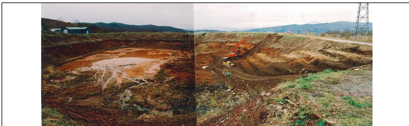
【図 2.3 旧幌別硫黄鉱山の脱水ケーキ堆積場】

これは典型的な過去の負の遺産です。しかし、将来を見据えて環境を守るために北海道内の鉱山でも坑内排水（坑水）の処理や坑水の排出量を減らすための新技術の開発が進められています。