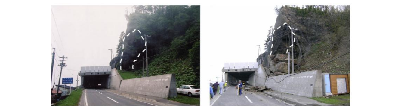
【図 2.2 岩盤崩落の例 左：崩壊前 右：崩壊後】 （清水順二氏作）

地質は新第三紀中新世のハイアロクラスタイトです。崩壊岩塊の大部分は、覆道に連続して設けられていた擁壁の山側に落下しましたが、いくつかの岩塊は道路まで達しました。崩壊直前に通行しようとしたダンプカーの運転手が、土煙が上がったのを目撃しています。