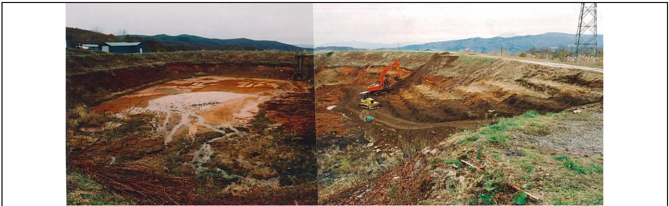
【図 2.3 旧幌別硫黄鉱山の脱水ケーキ堆積場】

これは典型的な過去の負の遺産です。しかし、将来を見据えて環境を守るために北海道内の鉱山でも坑内排水（坑水）の処理や坑水の排出量を減らすための新技術の開発が進められています。