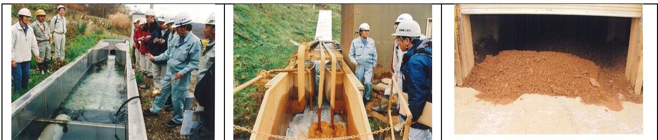
【図 2.4 旧別硫黄鉱山の排水処理】

鉱山からの排水を中和して出てきた脱水ケーキ（泥の固まり）を最終的に処分する堆積場を拡張中。褐色になっているのは水酸化鉄の色です。